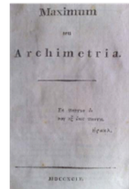
Bild 19: „Das Höchste oder Archimetria.“ Begeugt sind die Worte Heraklits: „Aus allem Eines und aus Einem Alles.“ (Akte Bibliothek, Hc 482)