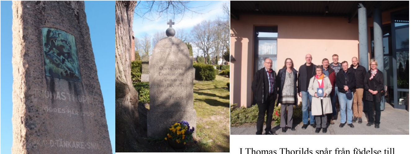
I Thomas Thorilds spår från födelse till grav