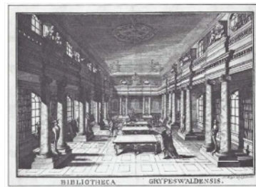
Bild 18: Die Bibliothek der Universität Greifswald, heute Aula. Kupferstich aus Academiae Grypswaldensis Bibliotheca, Tom. I. Greifswald 1775.