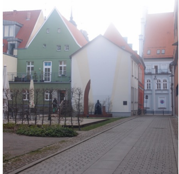
Thorilds Wirken an der Universität Greifswald

En guidad tur i slottet Griebenow i Neuenkirchen med smaklig sopplunch på gröna ärtor blev ännu en